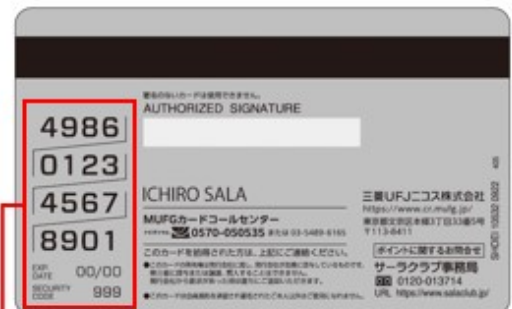
カード番号／有効期限／セキュリティコード

両社は今後も、サラカード会員が安全・安心、快適に利用できる付帯サービスや決済機能の拡充に努めてまいります。